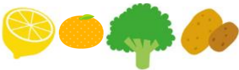
フルーツ・ブロッコリー・芋類など

ウイルスや細菌から体を守ります。体内に溜めておくことができないので、毎日の食事にビタミンCを取り入れましょう。